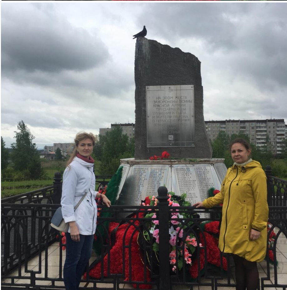
Возложение цветов на Кургане Памяти