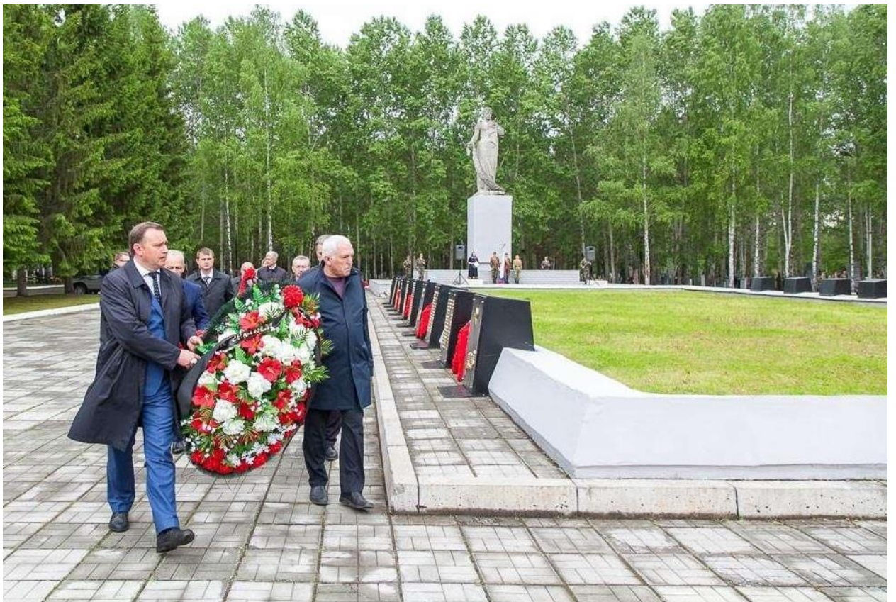
Митинг у Мемориала воинской славы на Рогожинском кладбище