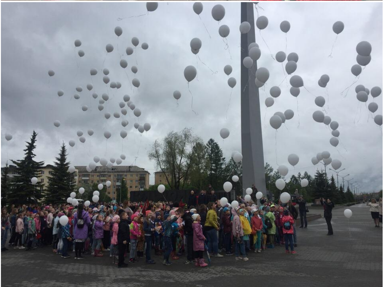
Митинг на площади Славы