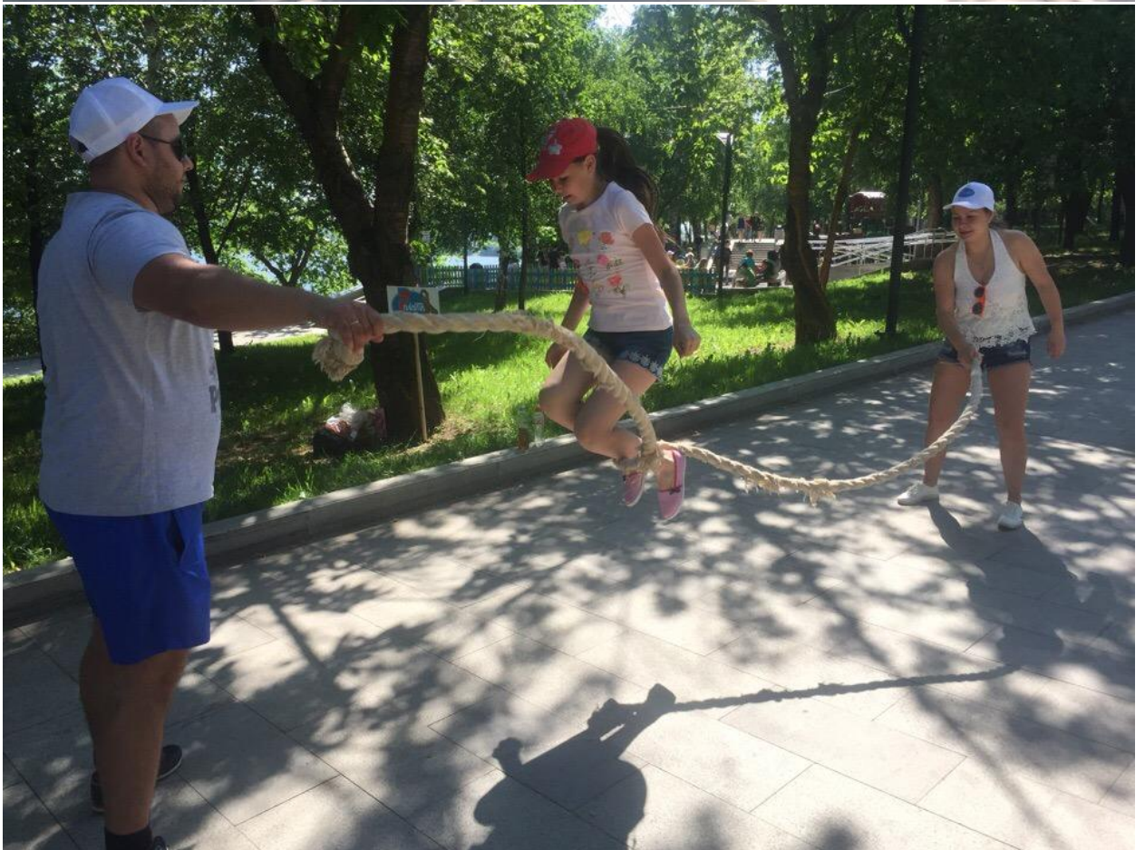
Представители молодежной организации участвуют в чемпионате по дворовым играм