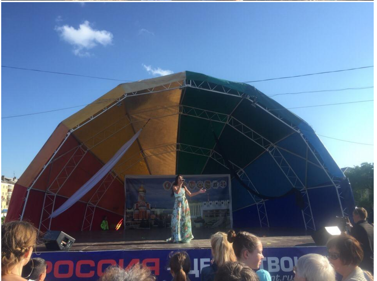
День молодежи в Дзержинском районе, представители Общества выступают на сцене