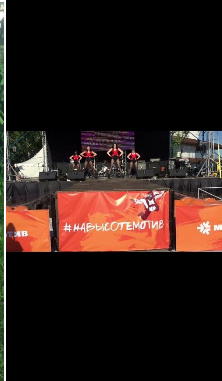
Финалисты конкурса «Соцветие талантов» танцевальная группа «Каблуки»